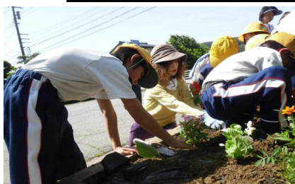
植え方を教えていただきました

5月25日(金)には、2年生が東布施公民館で、グリーンキーパーや公民館の方々にご指導いただき、花苗の植え付けにチャレンジしました。始めはおそるおそる植えていた子供たちも、いくつもの花苗を植えるうちに少しずつ慣れ、上手に植えることができるようになりました。植え付けが終わった後には、東布施公民館を見学させていただき、冷たいジュースもごちそうになりました。とても暑い日でしたが、地域の皆さんとふれ合い、大満足の1日でした。