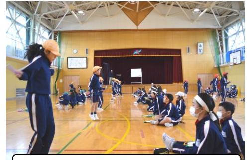
跳ぶ、数える、どちらも真剣！

1・4年、2・5年、3・6年がペア学年として一緒に大会を行うことで、上学年が下学年の回数を数えるとともに、下学年が上学年の跳び方を見て学ぶ機会ともなりました。縄跳び大会がよい刺激となり、休み時間には、これまで以上に熱心に練習に励む姿も見られます。縄跳びカードも活用し、がんばる子供たちを励ましたいと思います。