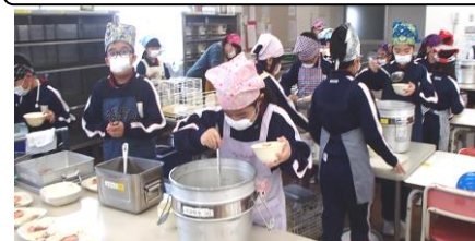
給食の配膳も3年生にお任せ