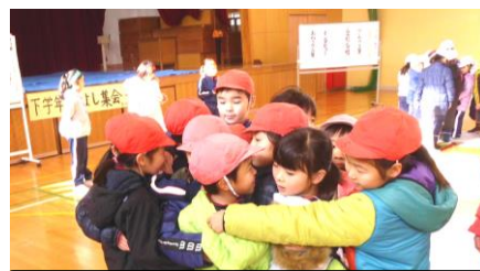
3年生の企画で楽しいゲーム

2限には「下学年なかよし集会」を企画して、1・2年生を楽しませてくれました。3年生からは「たった1日でも大変だったのに、5・6年生は毎日こんながんばっているなんて、やっぱり5・6年生はすごい」という感想が、また、2年生からは「今年の3年生のように、来年は自分たちが、委員会の仕事や集会をがんばりたい」などの感想が聞かれました。楽しく、それぞれが大きく成長した1日でした。