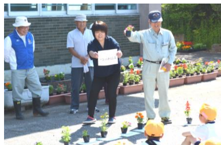
花の名前も教えていただきました！

5月24日(金)には、2年生が東布施公民館で、グリーンキーパーや公民館の方々にご指導いただき、花苗の植え付けにチャレンジしました。始めはおそるおそる植えていた子供たちも、いくつもの花苗を植えるうちに少しずつ慣れ、上手に植えることができるようになりました。植え付けが終わった後は、冷たいジュースもごちそうになり、お礼にみんなで歌う校歌を聞いていただきました。とても暑い日でしたが、地域の皆さんとふれ合い、大満足の1日でした。