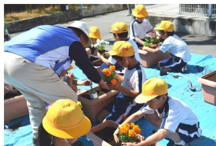
教えていただいたように丁寧に・・・

5月20日(月)、グリーンキーパーのご指導のもと、花苗の植え付けを行いました。今年度は、昨年までの5・6年生に代わり、プランターへの植え付けから水やり、草取り等、世話の全てを3年生が担当することになりました。昨年、一人一鉢で野菜を育てた経験のある3年生は、今年は学校の回りをきれいな花で飾ろうと張り切って植え付けに取り組みました。翌日から、毎朝、縦割りグループごとに協力して、一生懸命に水やりをしています。