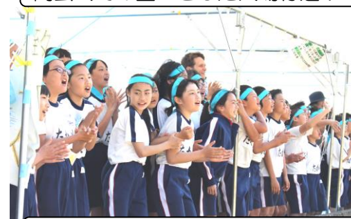
児童席から大声援を送りました。