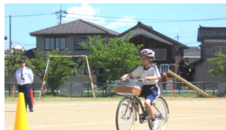
警察官の方に、一人一人の乗車の様子をしっかりと見ていただきました。