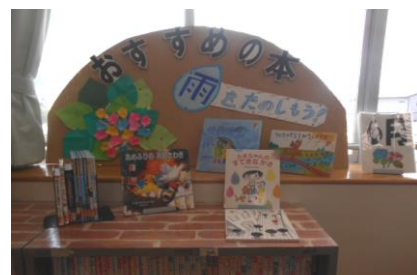
読んでみたくなるおすすめの本展示