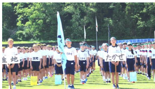
開会式での堂々とした入場行進！

今年度もPTA役員の皆様には、ご多用の中、当日朝のテント設営や終了後の撤去にご協力いただきました。おかげさまで、子供たちは最後まで元気いっぱい競技に応援に力を発揮し、充実した1日を過ごすことができました。快くご協力くださった役員の皆様に心より感謝しております。本当にありがとうございました。