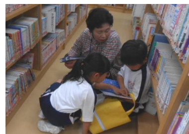
得能先生と一緒に本選び

たかせ小学校では、今年度も、子供たちが本を身近に感じ、読書の楽しさを味わうことができるよう様々な取組をしています。水曜・金曜の朝活動で全校一斉に取り組む「読書タイム」、学校司書による各学級での「読み聞かせ」、委員会児童がお世話する「図書貸し出し」、毎週金曜日、週末に向けて一人2冊まで本を借りることができる「読書大好きデー」など。読んだ本は「読書大好きカード」に記録することで、各自が自分の読書生活を振り返ることができるようにしています。毎年、最も多く読書している子供は、1年間で約400冊の本を読んでいます。6年間では…と考えると、すごいことです。