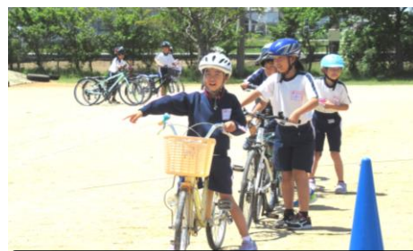
声を出し、指さして、安全確認！

子供たちにも話していますが、自転車乗車中は歩行中と比べて事故が起きやすく、万が一事故が起きると大ケガにつながる恐れもあります。4年生以上の子供たちも、①ヘルメットの着用、②横断時や右左折時の一旦停止、③左右確認等について、十分気を付けるよう繰り返しの声掛けをお願いします。