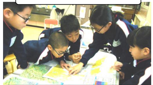
避難行動を考えるグループ学習