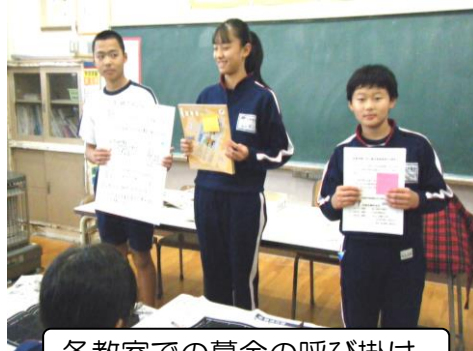
各教室での募金の呼び掛け

今年も、6年生が中心となって赤い羽根共同募金に取り組みました。自作のポスターを校内に貼ったり、各教室を回ったりして協力を呼び掛け、12月4～6日、児童玄関前で募金を集めました。