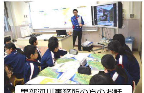
黒部河川事務所の方のお話

「家で避難する場合は1階ではなく2階に避難する」「雨が降ってからでは逃げ遅れるから降る前に逃げる」「安全な道を選び、できるだけ高いところに逃げる」など、グループ内で意見を出し合い、真剣に考える姿が見られました。万が一の場合に、落ち着いて行動できるよう、繰り返し学習や訓練に取り組んでいきたいと思えます。