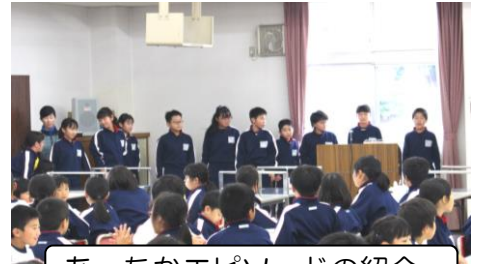
あったかエピソードの紹介

実生活場面で子供たちが勇気をもって「あったか言葉」を言ったり、「あったかアクション」をしたりできるようになるためには、ご家庭でのご協力が欠かせません。「ありがとう」「がんばっているね」「大丈夫」等、かけ言葉を、大人から進んで使っていきたいと思えます。