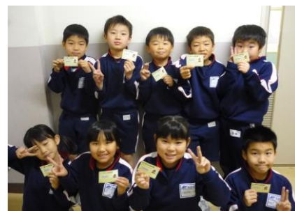
「九九免許状」に大満足の2年生

これからも、もっともっと「やってみよう」「やってみよう」「来てよかった」がいっぱいの学校になることを目指して、子供たちとともに考え、取り組んでいきたいと思っています。