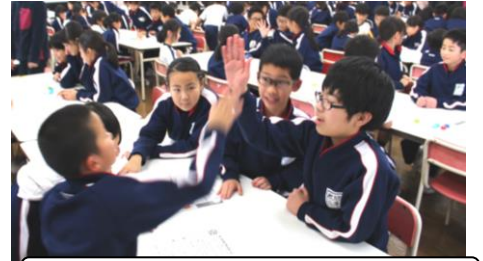
あったかすごろくでハイタッチ